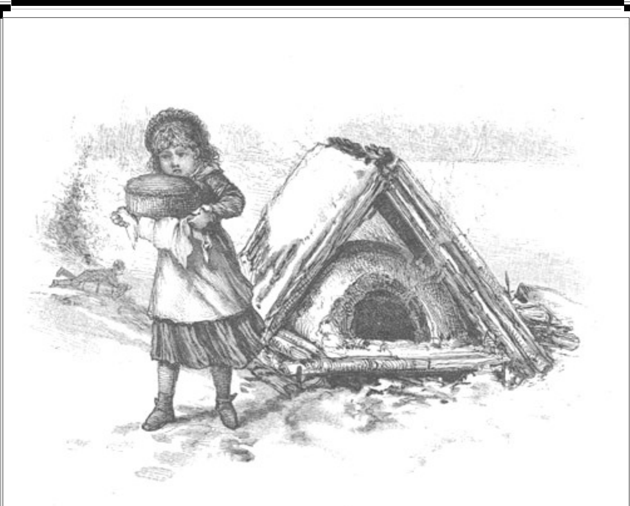
La petite fille au pain, Bibliothèque du Séminaire de Québec